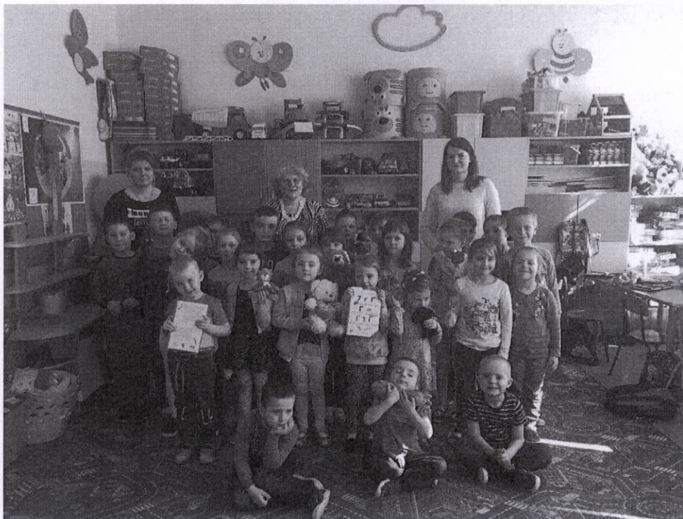
Głośne czytanie bajek w PSP Przewodowie Poduchownym