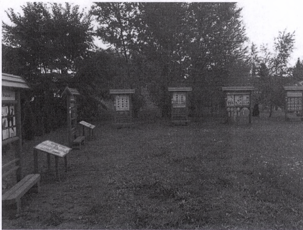
Ścieżka edukacyjna przy Publicznej Szkole Podstawowej w Skaszewie Włościańskim

Na realizację tego projektu poniesiono wydatki w łącznej kwocie 91.854,00 zł, dofinansowanie z Wojewódzkiego Funduszu Ochrony Środowiska i Gospodarki Wodnej wyniosło 80.000,00 zł, co stanowiło 87,09% wydatków ogółem .